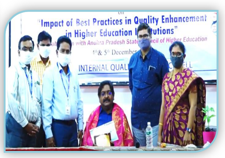
Felicitation to the Chief Guest