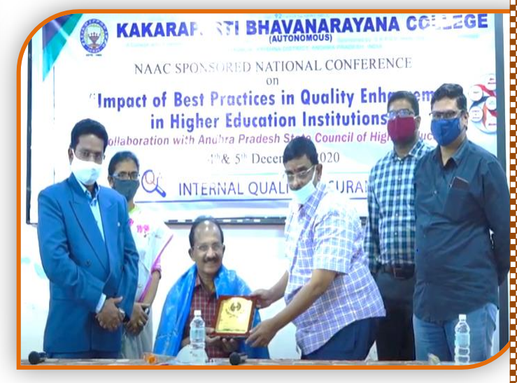
Felicitation to the Chief Guest